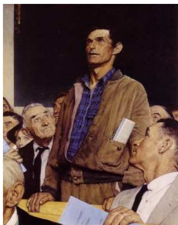
Norman Rockwell - "Liberta' di parola" - 1943 Olio su tela, 116x901 cm Norman Rockwell Museum, Stockbridge, Massachussets (USA)

Opera dedicata al senatore Giampiero D'Alia .