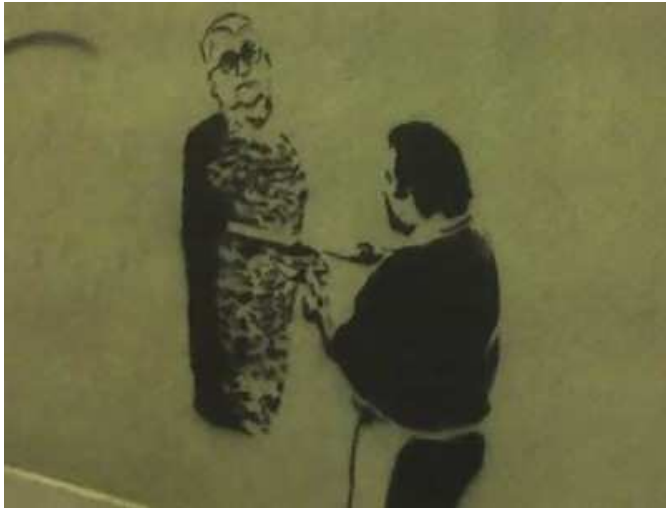
Graffitaro anonimo - " Borghesio-kebab " Graffito avvistato nel centro di Torino.