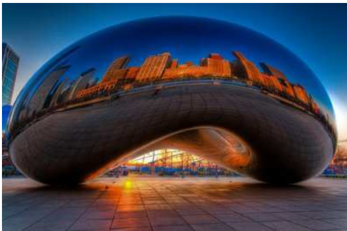
Anish Kapoor - "Cloud gate" - 2004/2006 Acciaio inossidabile, 10x20x13 metri Millenium Park, Chicago, Illinois, USA