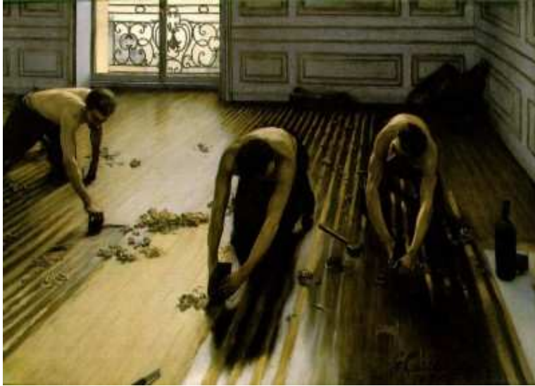
Gustave Caillebotte - "I levigatori di parquet" - 1875 Olio su tela, 102x146.5 cm Musee d'Orsay, Parigi, Francia