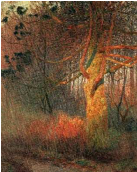
Emile Claus - "Albero al sole" - 1900 Olio su tela, 184x153 cm Museum voor Schone Kunsten, Gand, Belgio