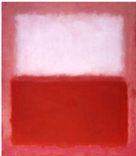
Mark Rothko - "White over red" - 1957