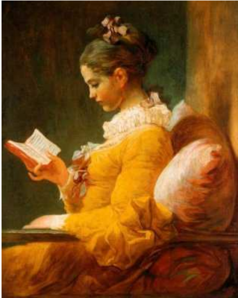
Jean-Honore' Fragonard - "La lettrice" - 1770/1772