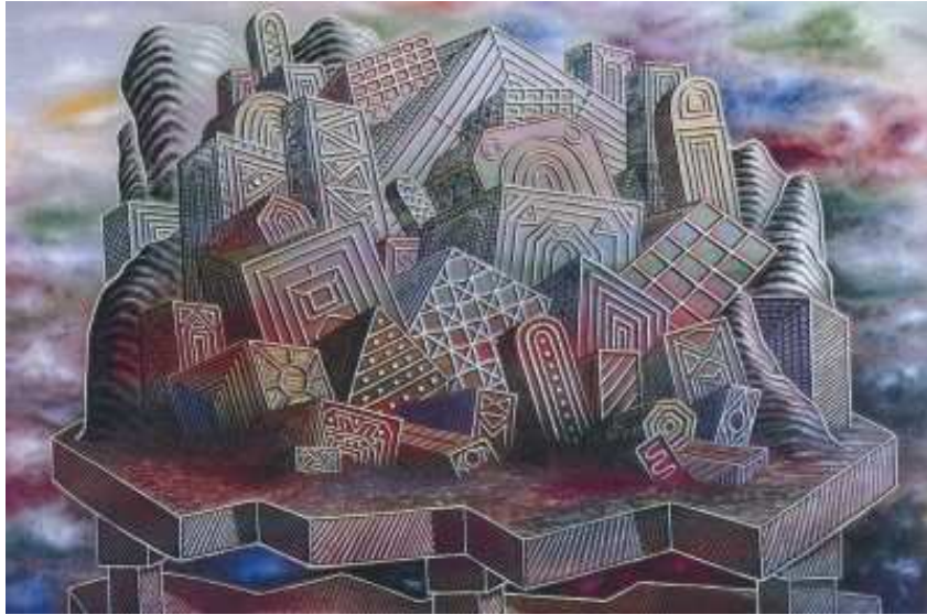
Alberto Savinio - " La città delle promesse " - 1928 Olio su tela Collezione privata