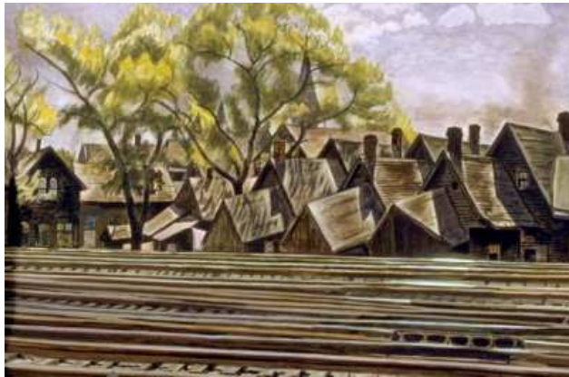
Charles Burchfield - "Railroad in spring" - 1933 Acquarello su tavola, 71.2x106.7 cm Fine Arts Museums of San Francisco, California, USA