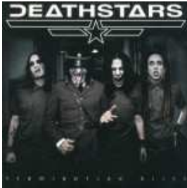
Deathstars - "Termination bliss" (2006)

I Deathstars sono senza alcun dubbio una delle proposte piu' interessanti nel panorama gothic metal internazionale. La voce di Andreas "Whiplasher Bernadotte" Bergh , avvolgente quando l'abbraccio di una fatale dark lady, si sovrappone a chitarre energiche il cui potenziale si articola sui rigidi schemi di una efficace ritmica ai limiti del marziale. Disco ottimo per essere ascoltato nelle sere invernali di luna piena.