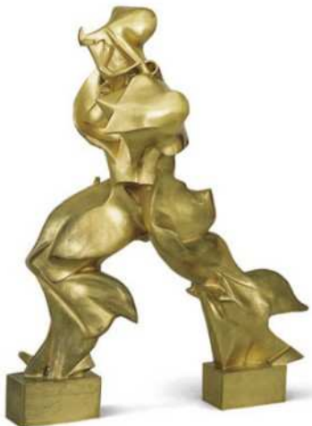
Umberto Boccioni - "Forme uniche della continuità nello spazio" - 1931 Bronzo, 111.2x88.5x40 cm Museum of Modern Arts (MoMA), New York, NY, USA