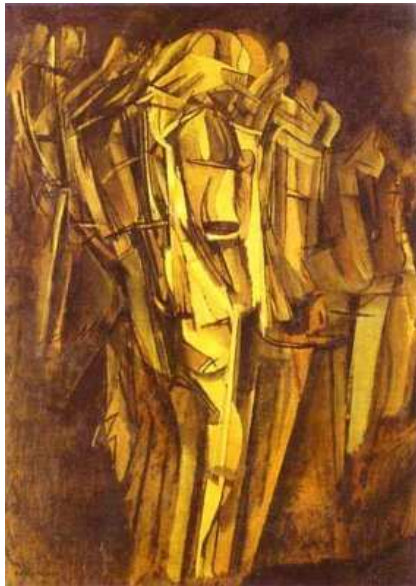
Marcel Duchamp - "Jeune homme triste dans un train" - 1911/1912 Olio su tela applicata su tavola, 100x73 cm Fondazione Peggy Guggenheim, Venezia, Italia