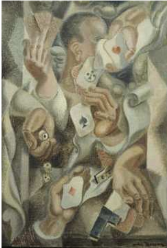
Andre' Masson - "Le Tour de cartes" - 1923 Olio su tela, 73x50.2 cm Museum of Modern Arts (MoMA), New York, NY, USA