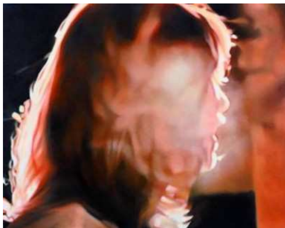
Judith Eisler - " Anhauchen " - 2006 Olio su tela, 81x102 cm