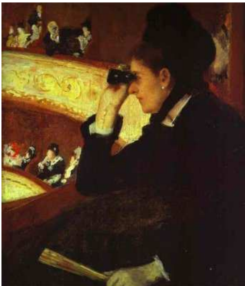
Mary Cassatt - "All'Opéra" - 1880 Olio su tela Museum of Fine Arts, Boston, MA, USA