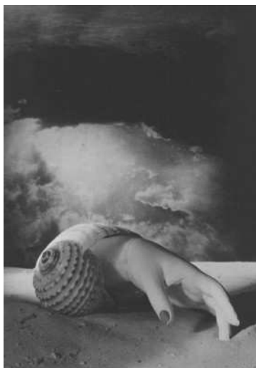
Dora Maar - " Senza titolo " - 1934

Musée nacional d'art moderne, Centre Pompidou, Paris