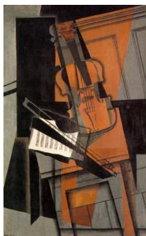
Juan Gris - "The violin" - 1916 Olio su tavola - 116.5x73 cm Kunstmuseum, Basel, Svizzera