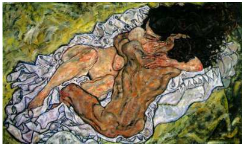
Egon Schiele - "Embrace (lovers II)" - 1917 Olio su tela, 100x170.2 cm Osterreichische Galerie, Vienna, Austria