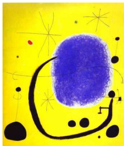
Joan Miro' - "The gold of the azure" - 1967 Olio su tela, 205x173.5 cm Fundacio' Joan Miro', Barcelona, Spain