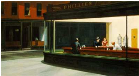
Edward Hopper - " Nighthawks " - 1942 Olio su tela, 152x76 cm The Art Institute of Chicago, Illinois, USA