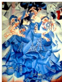
Gino Severini - "Ballerina blu" - 1912 Olio su tela - 61x46 cm Fondazione Guggenheim, Venezia, Italia