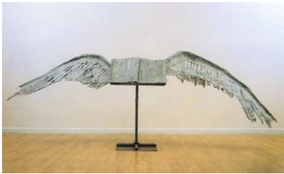
Anselm Kiefer - "Book with wings" - 1992-1994 Piombo, latta e acciaio - 189.9 x 529.9 x 110.2 cm Modern Art Museum of Fort Worth, Texas, USA

Parole ed espressioni ODIOSE (2) : il gergo dei negozi di abbigliamento femminile