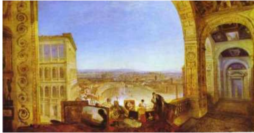
William Turner - "Rome, from the Vatican" - 1820 Olio su tela Tate Gallery, London, UK